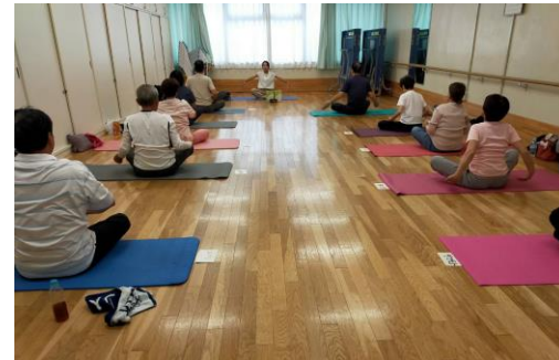
まちプラフリースペース・なないろヨガ