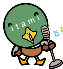
伊丹市マスコット たみまる