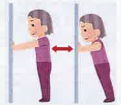
壁腕立てと同じ要領で